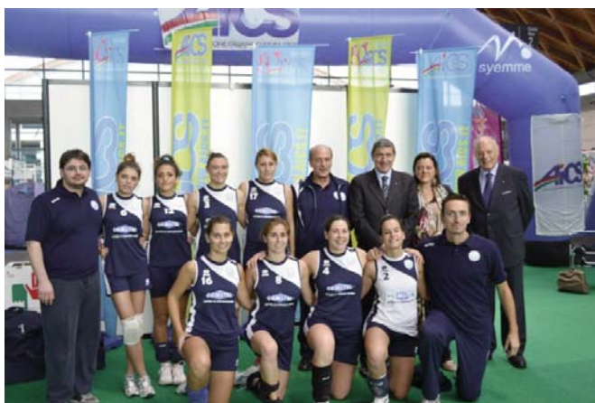
L'AIICS Volley di Forlì ha partecipato al torneo degli EPS