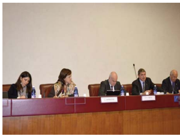
Tavolo della presidenza del convegno "Giovani e sport"